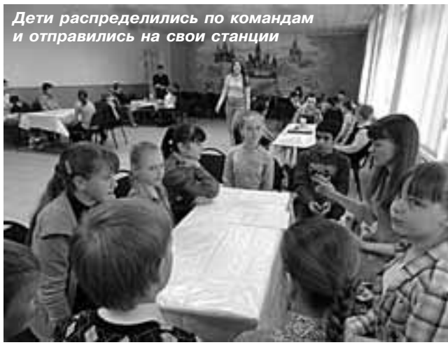
Дети распределились по командам и отправились на свои станции

большинство людей знает основные правила этикета и следует им. Для этого изучение основ этикета лучше начинать с детства, используя доступную и увлекательную форму подачи материала. Нам представляется, что лучшим решением этой проблемы будет обучающая игра для школьников по правилам этикета. Обычно дети делятся всем новым и интересным со своими родителями, поэтому их внимание также будет привлечено к проблемам этикета.